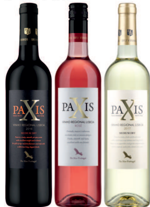
PAXIS PAXIS PAXIS PAXIS