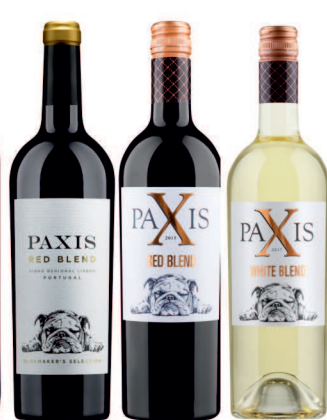
PAXIS PAXIS PAXIS