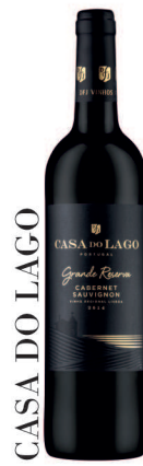
CASA DO LAGO