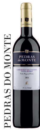
PEDRAS DO MONTE